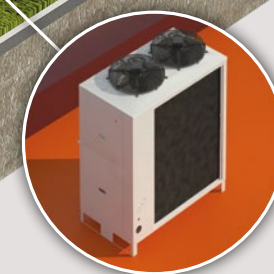
Groupe de condensation DUO CU 6 > 48 kW