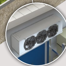
Évaporateur cubique 3C-A 1 > 35 kW