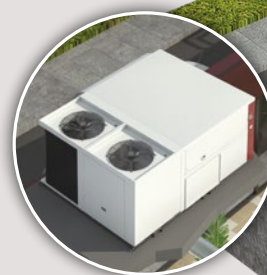
Unité de toiture rooftop air/air BALTIC 24 > 85 kW