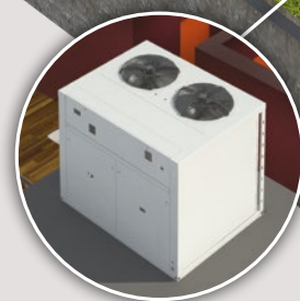
Groupes de production d'eau glacée et pompes à chaleur air/eau eCOMFORT 20 > 190 kW