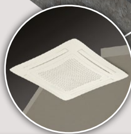
Cassette à eau glacée ARMONIA 1,3 > 11 kW